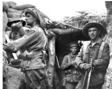
Australische troepen van de 1 ste Brigade in veroverde Turkse loopgraven

Uiteindelijk weten de Australiërs een aantal steunpunten in de veroverde loopgraven in te richten. Nu is het de beurt aan de Turken om tegenaanvallen uit te voeren. Dat doen ze gedurende drie dagen. De Australiërs zetten hun laatste reserves in, maar moeten het veld ruimen. Tot hun grote verbazing doen de Turken dat echter ook, zodat ze uiteindelijk toch in bezit blijven van het slagveld.