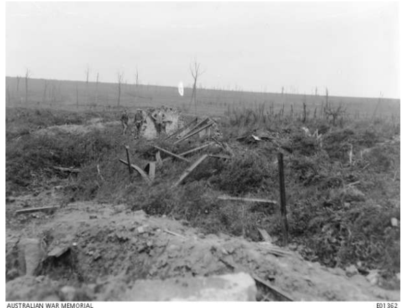
De omgeving van GREY FARM

'The 39th attacking the defences immediately north of Grey Farm had also been met by the fire of a machine-gun emplaced on the roof of a concrete shelter. This forced the troops in that area to ground, and for a time the check seemed likely to become dangerous. In this crisis Captain Paterson himself managed to suppress with a rifle the fire of the machine-gun, and, during its silence, rushed forward with the men nearest to him, and seized the post, capturing two machine-guns. The 34th and 39th dug in on their final objective, 100 yards beyond the alignment of Grey Farm; 500 yards ahead, beyond a slight dip of the plateau, lay the Oosttaverne Line.'