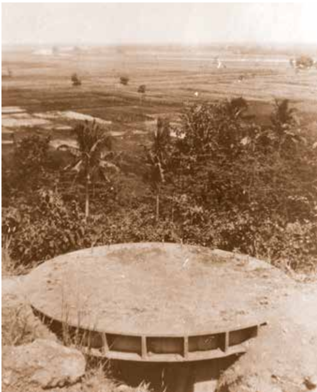
Pillbox achter de Porong-rivier nabij de monding van de Brantas

Door het mislukken van de tegenaanval was het Ilgen duidelijk geworden dat de Japanners met sterke krachten langs twee assen in een dubbele omvatting richting Soerabaja in opmars waren. Hij besloot daarop in de namiddag van 5 maart Soerabaja los te laten en zijn mobiele troepen rond Porong te concentreren. Hiermee plaatste hij het mobiele deel van zijn troepen buiten de Japanse dubbele omvatting. Het statisch deel van zijn troepenmacht moest de stad verdedigen. Vanuit Porong kon Ilgen de Japanse opmars richting Soerabaja in de rug bedreigen. Daarnaast bood deze opstelling hem de mogelijkheid verder landinwaarts terug te trekken. Daar dacht hij vervolgens een guerrilla te kunnen voeren. 18