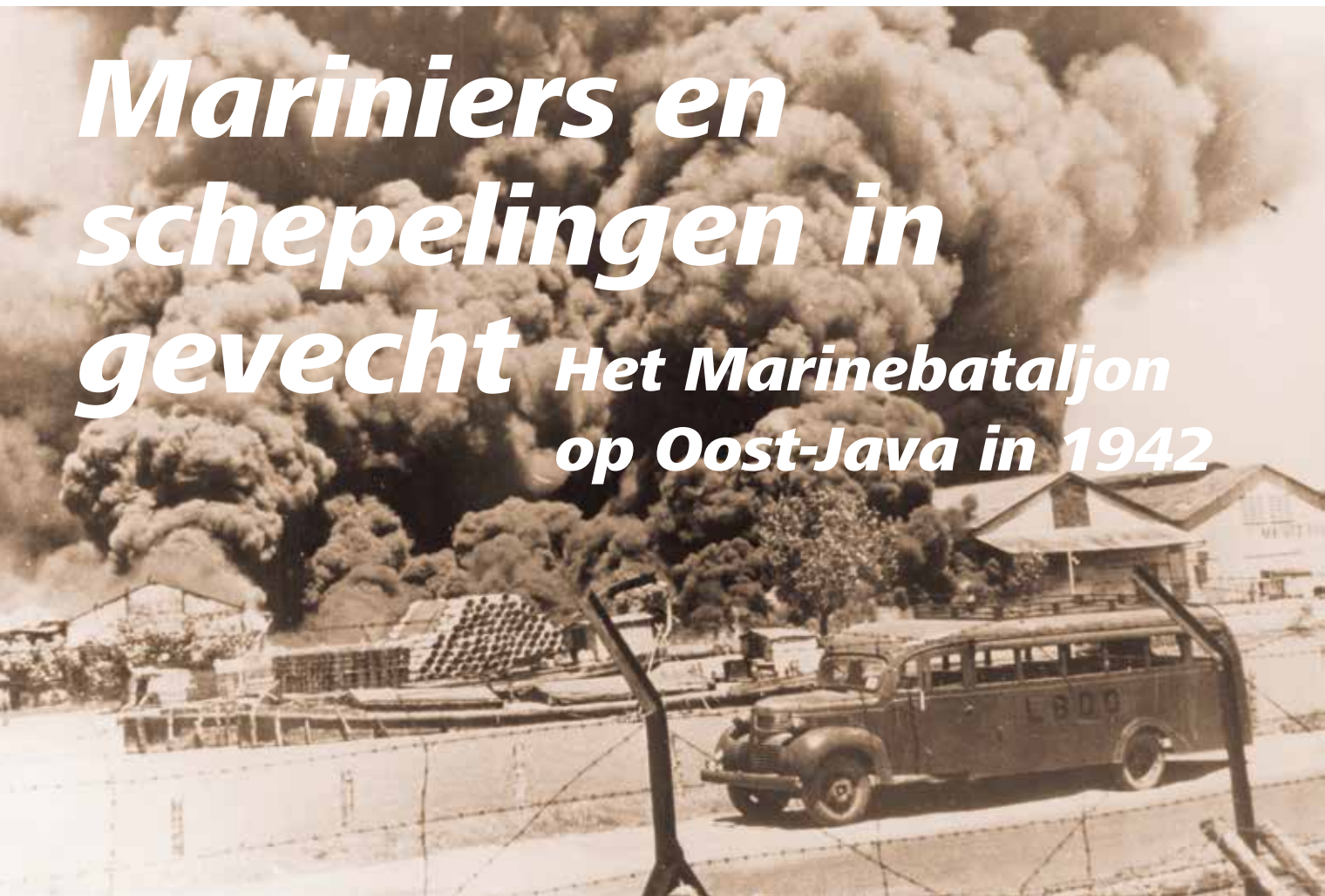
Marine Etablissement Oedjong gehuld in rook na een Japans bombardement, maart 1942

Na de zware nederlaag van de Geallieerde Combined Striking Force in de Javazee op 27 februari 1942 voerde de Japanse invasiemacht amfibische landingen uit op Java. Dit betekende niet het eind van de inzet van de Koninklijke Marine. Een bataljon mariniers en schepelingen vocht onder operationeel bevel van het Koninklijk Nederlands-Indisch Leger in Oost-Java nog een korte en chaotische strijd met de Japanners. In dit artikel wordt dit optreden van het Marinebataljon beschreven en geanalyseerd. Welke taken kreeg het Marinebataljon, was het hiervoor organisatorisch, qua bewapening en opleiding toegerust en hoe heeft het bataljon deze uitgevoerd? De Japanse aanvalsplannen en uitvoering in Oost-Java worden kort beschreven. 1 In dit artikel wordt voor plaatsnamen de oude spelling toegepast.