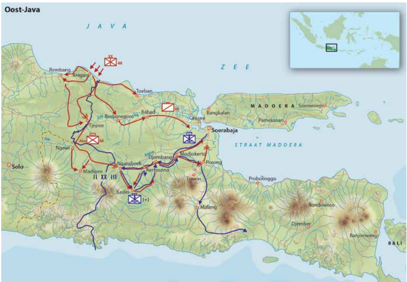
Het operatiegebied Oost-Java (E. van Oosten, Nationaal Instituut voor Militaire Historie)

richting Tjepoe aanvallen en de Japanse noodbrug aldaar vernielen. De vijandelijke eenheden op de oostelijke oever zouden zo worden afgesneden wat kans bood hen afzonderlijk te verslaan. Volgens Roelofsen schatte de divisiestaf de vijandelijke sterkte op circa 350 man. Achter de Brantas moest Groep Zuid met twee tweedelijns bataljons en een afdeling veldartillerie de zuidwestelijke opmarsroute naar Soerabaja afsluiten. Ilgen zette voor zijn tegenaanval niet de gehele Mobiele Groep in. Eén infanteriebataljon hield hij achter te Soerabaja met het oog op mogelijke Japanse luchtladingen. Doordat zijn veldartillerie was ingedeeld bij de Groep Zuid miste de tegenaanval vuursteun. Daarnaast waren de aan de Zuidcolonne toegevoegde eenheden numeriek te zwak. Het Nederlandse offensief ontbeerde zo stootkracht. Fundamenteel was dat aan het operatieplan een onjuiste analyse van de vijand ten grondslag lag. 16 De tegenaanval van Ilgen vond plaats langs dezelfde assen als de opmars van de 48ste Divisie. In beide gevallen leidde dit tot ontmoetingsgevechten. De voorhoede van de Noordcolonne botste op de Japanse nevenaanval en werd na een kort gevecht teruggeslagen. Op de zuidelijke aanvalskant kwam het Detachement De longh in gevecht met de voorhoede van de Gevechtsgroep Abe. Het werd in een vertragend gevecht teruggedreven nog voordat het Marinebataljon was gearriveerd. Door de snelle en krachtige Japanse opmars kwam zo aan de tegenaanval een eind nog voordat deze goed en wel begonnen was.