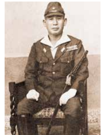
Luitenant-generaal Yuitsu Tsuchihashi