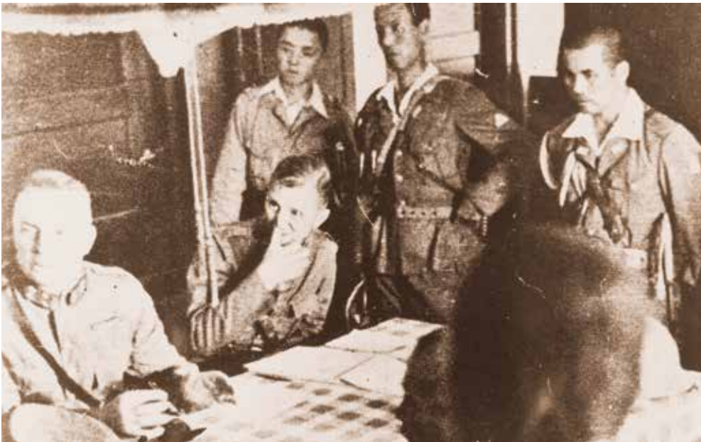
Overgave van het KNIL in Kalidjati. Lt. Gen. Ter Poorten (eerste links) en Lt. Kol. Mantel (tweede links)

die niet alleen operationeel, maar ook tactisch telkens de meerdere bleek van de Nederlandse troepen. Ook wat betreft de snelheid van hun opmars. Dit ondanks het 'bar slecht' schieten en dat het geen 'prima troepen' waren. 21