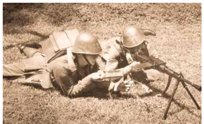
Lichte mitrailleurteam van het Marinebataljon met de Breda M30 7,35 mm. Dit was een door de Britten in Afrika buitgemaakt Italiaans wapen

De Japanse landing bij Kragan vond niet zonder tegenstand plaats. B-17 zware bommenwerpers (USAAF) en Vildebeest torpedobommenwerpers (RAF) voerden in de nacht bombardementen uit, gevolgd in de ochtend door