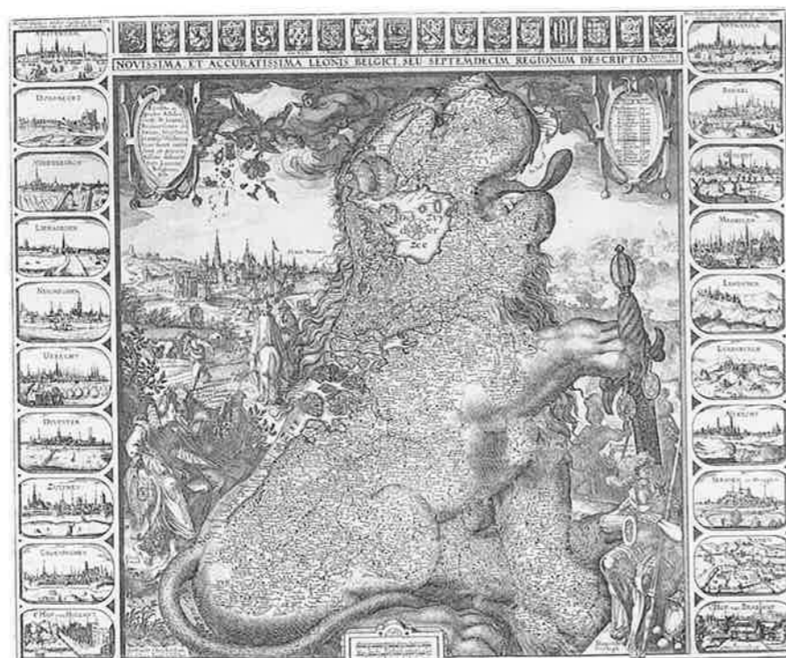
Afbeelding 1. Kaart van de zeventien provinciën. ZA, KZGW, Zel. III. I-10.

De lotgevallen van Sluis in het begin van de zeventiende eeuw waren nauw verbonden met deze van heel kust-Vlaanderen en in het bijzonder van Oostende. Die havenstad was rond 1600 stevig in Staatse handen. Ze diende niet alleen als uitvalsbasis voor strooptochten op het omliggende platteland, tot aan de poorten van Gent toe, wat de Republiek aardig wat inkomsten opleverde, maar ze vormde bovendien een belangrijke schakel in offensieve acties in Vlaanderen. Vooral Oostende maakte, als een luis in de Spaanse pels, dat de oorlogshandelingen zich voor het grootste deel bleven afspelen in het Zuiden en dat het grondgebied van de Republiek zelf minder de oorlogslast te dragen kreeg. Afgezien van de vraag of Maurits en later Frederik Hendrik al dan niet geïnteresseerd waren in een verdere verovering van Vlaams grondgebied – dat is dan de interne Staatse keuken – is het onmiskenbaar zo dat het bezit van Oostende voor de Republiek meer voordelen inhield dan nadelen.